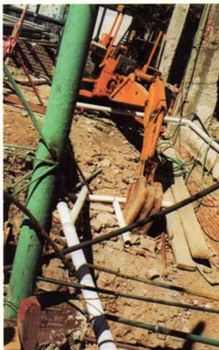
Inicio de la excavación del techo del búnker en 1999.

Durante el año 1955 el gobierno militar abrió al público el búnker y miles de niños lo visitaron al igual que se hizo campaña mostrando los trajes de lujo de Eva y sus joyas y otras excentricidades de fuerte impacto emocional que por cierto jamás estuvieron en el lugar salvo para mostrarlos. Luego fue cerrado, saqueado y olvidado.