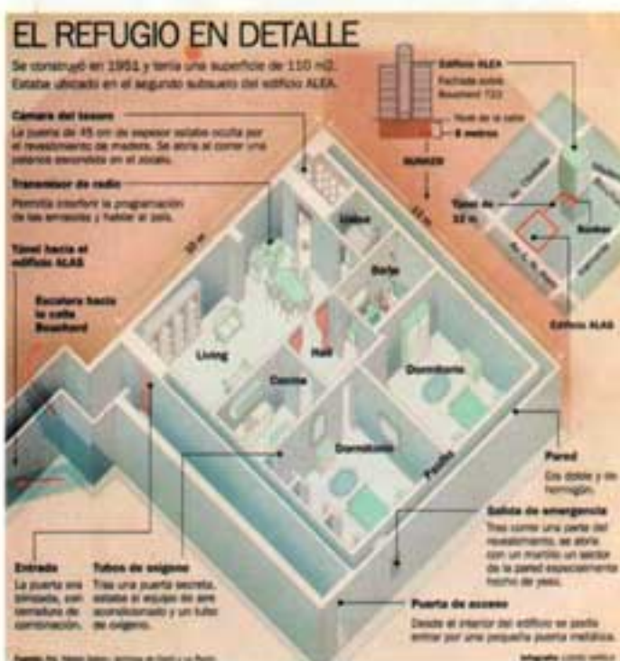
Planta con la distribución de ambientes del búnker (Archivo Clarín, Infografía).

La decoración era sobria, paneles de madera simples, un enchapado; obviamente cuando se lo abrió al público con grandes titulares de los diarios mostraron las joyas de Eva Duarte y lo usaron mediáticamente como golpe de efecto, como "la guarida del tirano" y otros epítetos similares. Nada más alejado de eso ya que los dos únicos roperos que tenía el conjunto hoy no alcanzarían para la ropa de cualquier adolescente. Separemos realidad y fantasía y esas fotos tomadas