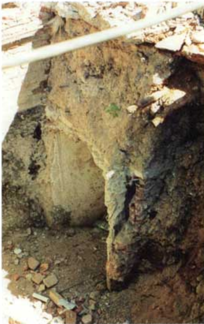
El túnel principal durante su destrucción.