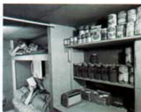
Revistas de los Estados Unidos difundiendo el uso de refugios nucleares públicos y privados.

desto, quizás ineficaz en caso de guerra nuclear o siquiera ante un bombardeo al sitio, pero se hizo.