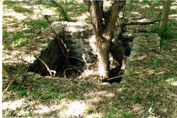
Fig. 8 Construcción cuadrada, posible jaguel conservado completo (2003)

La Formación de una Ruina Histórica : O como la Estancia Jesuítica de San Ignacio paso a ser Arqueológica (Cordoba, Argentina).