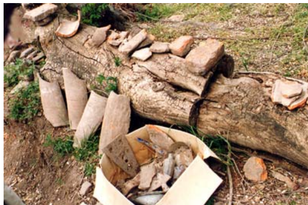
Fig. 11 Objetos, tejas y ladrillos abandonados en el sitio después de la destrucción de 1998.