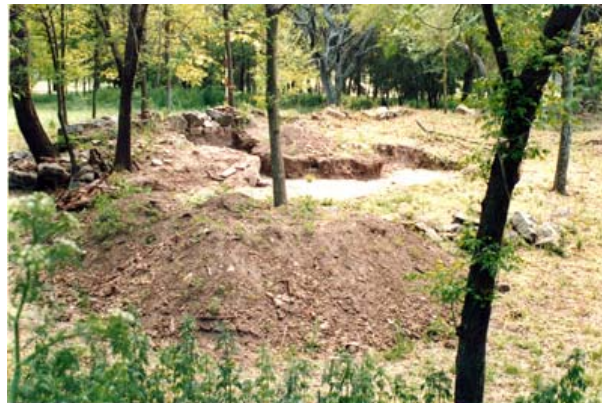
Fig. 9 Sector central de la iglesia saqueado en 1998 por los propietarios.