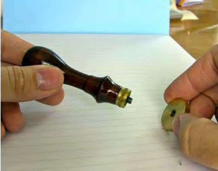
Ejemplo de la forma de uso de estos sellos que se mantiene hasta la actualidad

Como en todos estos casos el trabajo que se lleva a cabo para su restauración ha sido complejo y lento ya que el estado de alteración en que fue hallado era avanzado.