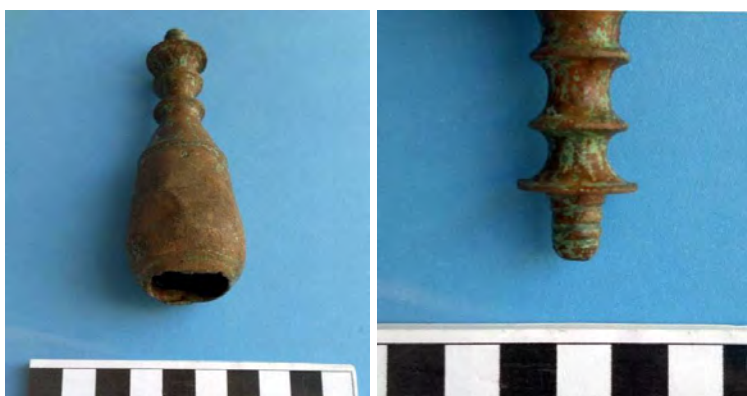
Vista de la parte superior e inferior del mango del sello