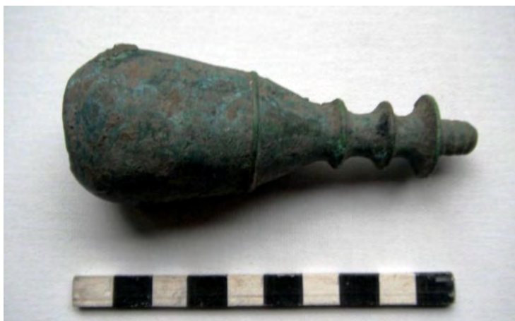
El mango tal como fue encontrado, antes de su limpieza

S iguendo con los hallazgos insólitos de esta excavación, se encontró en uno de los niveles más profundos, en un contexto que nos continúa demostrando ser de fines del siglo XVII a inicios del XVIII, un mango de 10 cm de largo hecho en cobre. Tiene forma de pera, varias molduras decorativas, es hueco por dentro y tiene un agujero en la parte superior. Es posible que fuera de madera en su interior pero nada ha quedado para demostrarlo. Seguramente el agujero, necesario para trabajar el metal, haya quedado cerrado por un círculo de también de madera u otro ornamento ya perdido. En la parte inferior posee un apéndice roscado. Llama la atención esa rosca por la forma, de paso ancho y hendiduras oblicuas hacia un lado, posiblemente producto de manufactura de torno. No hay indicios de la parte inferior, es decir del sello propiamente dicho.