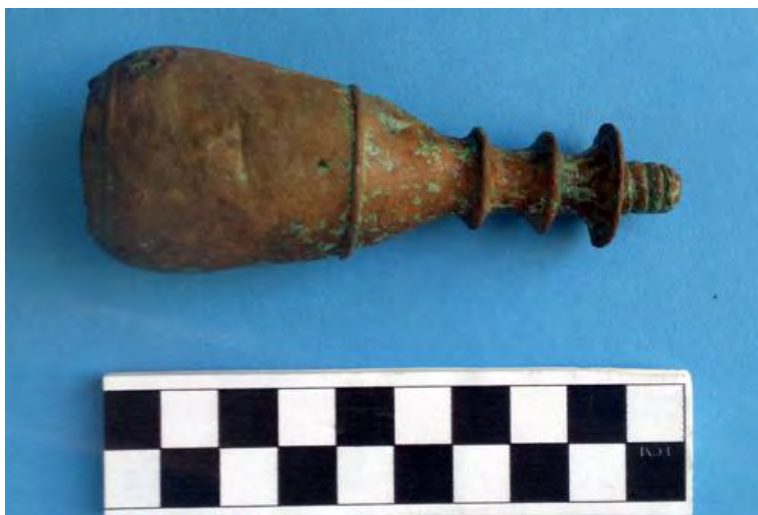
Probable mango de sello hecho de cobre ya restaurado

Por supuesto que podría ser otra cosa, ya que muchos objetos tenían manijas de este tipo, más aun adaptadas a la mano humana como es esto, pero lo reducido del vástago roscado hace difícil que haya sido usada en un bastón u otro objeto que ejerce fuerza que no sea vertical. Estudios comparativos más detallados nos permitirán determinar mejor su posible uso.